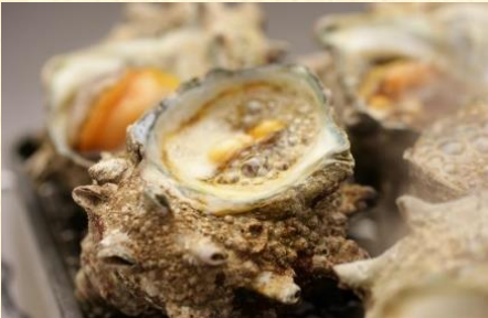
「たぐいえのつぼ焼き」